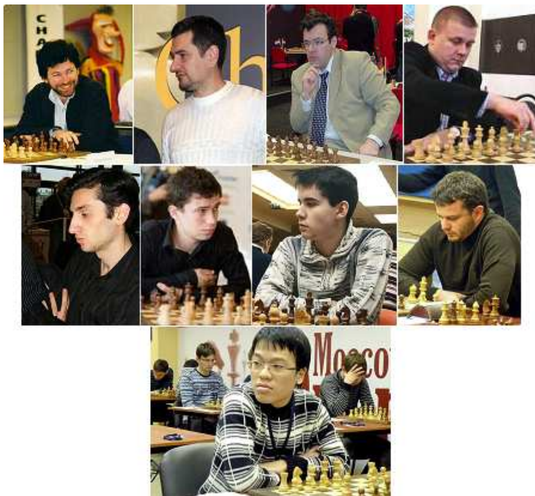
Galeria Zwycięzców Aeroflot Open (od pierwszej, do ostatniej edycji)